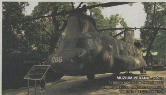
MUZIUM PERANG ... antara tinggalan peraratan tenteraan yang diunjurkan pablisasi dalam perang Vietnam dengan Amerika

Di Saigon Square pula, anda boleh mendapatkan beg, kemaja, kasut kasut serta barangan kulit berjenama terkenal seperti