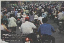
PADAT ...di setiap jalanan di Ho Chi Minh dipenuhi dengan motosikal.