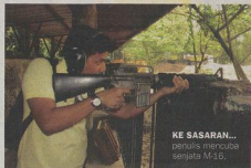
KE SASARAN ... penulis marcupi senjata M-16.

Giorgio Armani, Todd, Mont Blanc, Mango, Cartier bagi harga yang berpatutan.